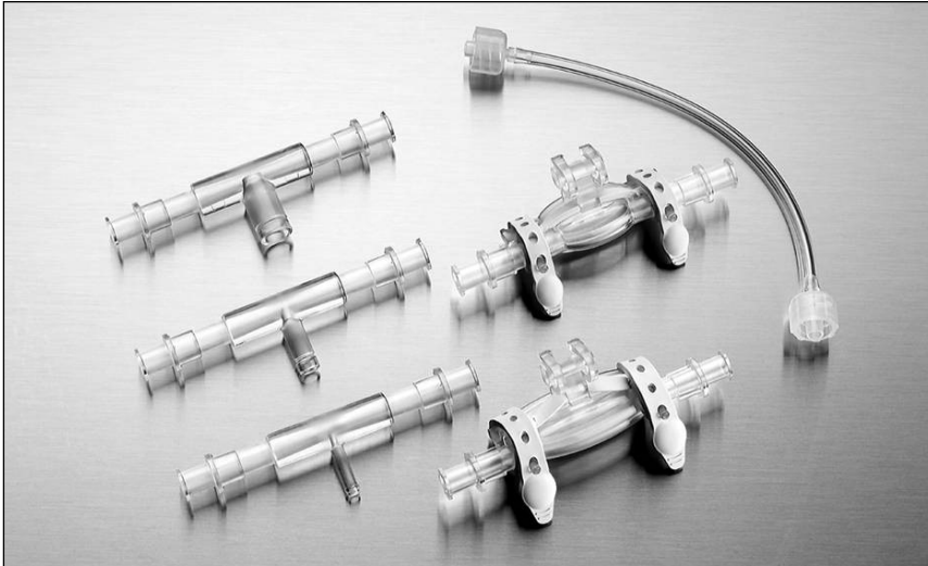
Abb.1: Konnektoren/ Patchklemmen für den Anschluss der Arterie(n) an die Pumpe